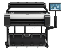
TM-305 MFP T36