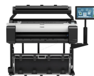
TM-300 MFP T36