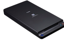
DIN A4 Flachbettscanner-Einheit 102