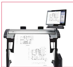
IQ Quattro X 44 MFP Repro

IQ Quattro X 44 MFP Repro steht für höchste Anforderungen an Qualität, Flexibilität und Zuverlässigkeit – und das jeden Tag.