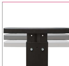
Höhenverstellbarer Standfuß für optimale Ergonomie