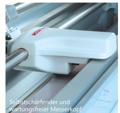
Selbstschärfender und wartungsfreier Messerkopf