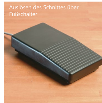
Auslösen des Schnittes über Fußschalter