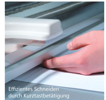
Effizientes Schneiden durch Kurztastbetätigung