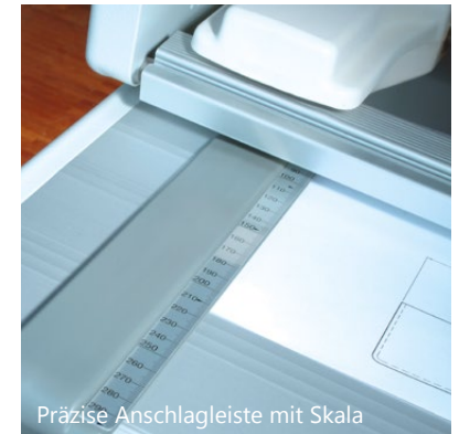
Präzise Anschlagleiste mit Skala