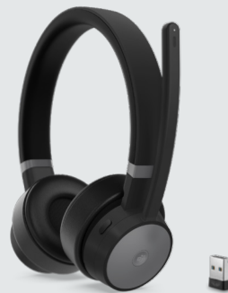
Lenovo Go Wireless ANC Headset ARTIKELNR.: 4XD1C99222, 4XD1C99221 (ohne Standfuß)

Das Lenovo USB-C Universal Business Dock wurde für moderne Anwender entwickelt und bietet alles, was Sie zur Steigerung Ihrer Produktivität benötigen. Dank den erweiterten Anschlussmöglichkeiten, der optimalen Stromversorgung und der Unterstützung für zwei Bildschirme in einem kleinen, platzsparenden und eleganten Gehäuse ist das Dock der perfekte Begleiter für hybride Arbeitsumgebungen. Dank mehr als 11 praktischen Erweiterungsanschlüssen können Sie Ihren Arbeitsplatz und -ablauf einfacher als je zuvor optimieren. Es ermöglicht blitzschnelle Datenübertragungen, den Anschluss von zwei 4K-Monitoren und schnelles Aufladen für Notebooks mit bis zu 65 W mit dem mitgelieferten Adapter oder bis zu 100 W mit dem optionalen 135 W-Adapter. Darüber hinaus unterstützt es auch Firmware-Updates mit nur einem Klick, sogar ohne Dock Manager.