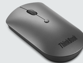
ThinkBook Bluetooth Silent Mouse ARTIKELNR.: 4Y50X88824

Das Lenovo Go Wireless ANC-Headset mit Teams-Zertifizierung wurde entwickelt, um Umgebungsgeräusche zu reduzieren und auch unterwegs Produktivität zu ermöglichen. Der USB-A-Bluetooth-Empfänger bietet eine ausgezeichnete Verbindung. Dank der Microsoft Teams-Zertifizierung und der hochmodernen Geräuscherdrückungstechnologie haben sowohl die Mitarbeiter im Büro als auch ihre ortsunabhängigen Kollegen die Möglichkeit, Ablenkungen auszublenden und sich auf ihre Arbeit zu konzentrieren – und das alles mit nur einem Headset. Dieses unterstützt duale Konnektivität über Bluetooth 5.0 und USB-Audio für Multitasking und die fortschrittliche Geräuscherdrückung mit ANC und ENC optimiert die Klangqualität und die Talk-Through-Funktion. Die Ladezeit bei Schnellladung beträgt 1,5 Stunden, die Wiedergabezeit bis zu 35 Stunden.