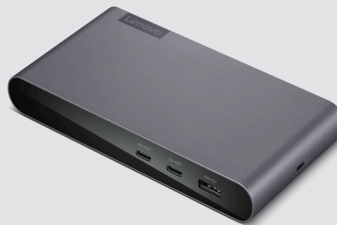
LENOVO USB-C UNIVERSAL BUSINESS DOCK ARTIKELNR.: 40B30090XX

Diese schlanke, elegante Maus in Standardgröße bietet herausragende Qualität für eine moderne kabellose Reiselösung. Die kompakte Maus für Rechts- und Linkshänder zeichnet sich durch exzellente Mobilität und perfekte Ergonomie aus. Der optische 1.200-dpi-Sensor ermöglicht leichtgängiges, präzises Arbeiten. Für die Verbindung zu allen kompatiblen Lenovo Geräten ist nur ein Nano-Empfänger erforderlich.