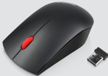
THINKPAD ESSENTIAL FUNKMAUS ARTIKELNR.: 4X30M56887

Diese schlanke, elegante Maus in Standardgröße bietet herausragende Qualität für eine moderne kabellose Reiselösung. Die kompakte Maus für Rechts- und Linkshänder zeichnet sich durch exzellente Mobilität und perfekte Ergonomie aus. Der optische 1.200-dpi-Sensor ermöglicht leichtgängiges, präzises Arbeiten. Für die Verbindung zu allen kompatiblen Lenovo Geräten ist nur ein Nano-Empfänger erforderlich.