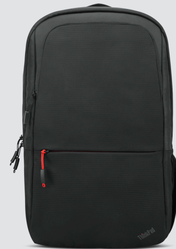
THINKPAD ESSENTIAL 40,6 CM (16'') RUCKSACK (ECO) ARTIKELNR.: 4X41C12468

Das Lenovo USB-C Universal Business Dock wurde für moderne Anwender entwickelt und bietet alles, was Sie zur Steigerung Ihrer Produktivität benötigen. Dank den erweiterten Anschlussmöglichkeiten, der optimalen Stromversorgung und der Unterstützung für zwei Bildschirme in einem kleinen, platzsparenden und eleganten Gehäuse ist das Dock der perfekte Begleiter für hybride Arbeitsumgebungen.