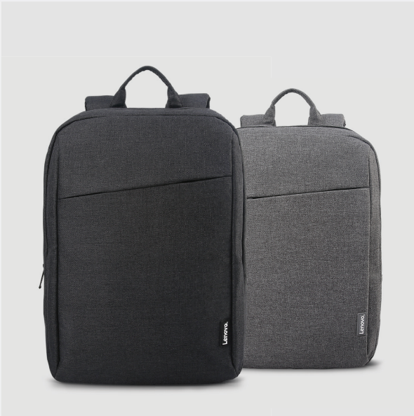
LENOVO 39,6 CM (15,6") NOTEBOOKRUCKSACK B210 ARTIKELNR.: 4X40T84059 (BLACK), 4X40T84058 (GREY)

Ein lässiger, eleganter Rucksack aus strapazierfähigem, hochwertigem, wasserabweisendem Textil. Mit seinem großen Stauraum eignet er sich perfekt für 38,1 cm (15") Notebooks und bietet viele praktisch platzierte Fächer und Taschen.